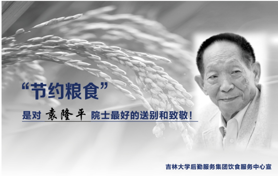
吉林大学后勤服务集团饮食服务中心宣

要做厉行节约的守护人、我们要做厉行节约的监督员，在做任何事的时候形成自觉，争做勤俭节约的先锋，我要做到：